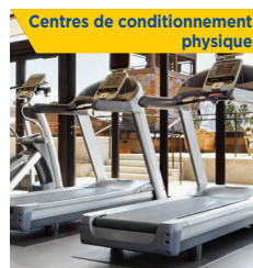
Centres de conditionnement physique