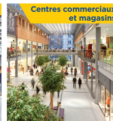
Centres commerciaux et magasins